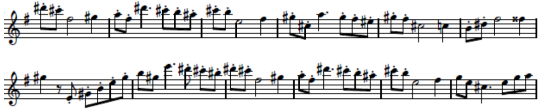
شكل (٧) يوضح الأداء المتقطع Staccato

الصيغة الثانية B: تبدأ من م ١٧ : م ٣٢ ويقوم المؤلف في هذه التيمة اللحنية بالانتقال الي سلم آخر بعمل تتابع لحني هابط في سلم (مي الكبير) بأستخدام اسلوب الأداء المتقطع Staccato فيقوم العازف بالتدريب علي التحكم في أن يكون اللسان غير مرئى أثناء العزف، لأن ظهوره بين الشفاه يعيق وضوح أساليب النطق وفتحة الفم أثناء " الأداء المتقطع Staccato ويعتمد العزف في هذه التيمة علي ضربات اللسان الفردية Single Tanguing لكي يستطيع عزف الأداء المتقطع Staccato.