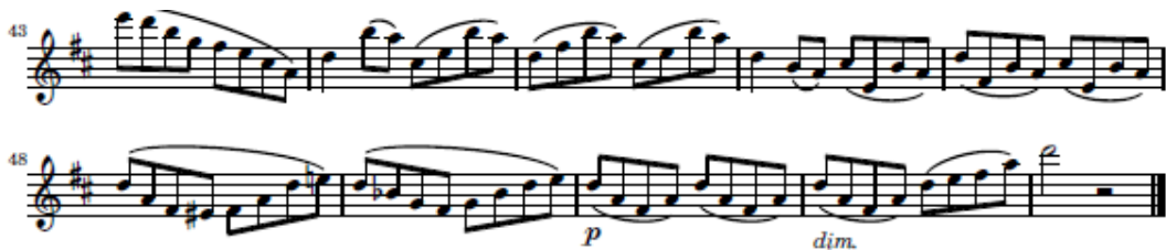
شكل (٤) يوضح الاختلاف في نهاية المقطوعة