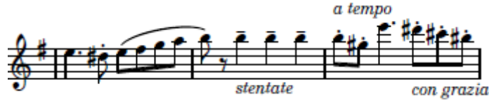
شكل (٦) يوضح التحويل لسلم مي الكبير وبداية الصيغة الثانية B

الصيغة الثانية B: تبدأ من م ١٧ : م ٣٢ ويقوم المؤلف في هذه التيمة اللحنية بالانتقال الي سلم آخر بعمل تتابع لحني هابط في سلم (مي الكبير) بأستخدام اسلوب الأداء المتقطع Staccato فيقوم العازف بالتدريب علي التحكم في أن يكون اللسان غير مرئى أثناء العزف، لأن ظهوره بين الشفاه يعيق وضوح أساليب النطق وفتحة الفم أثناء " الأداء المتقطع Staccato ويعتمد العزف في هذه التيمة علي ضربات اللسان الفردية Single Tanguing لكي يستطيع عزف الأداء المتقطع Staccato.