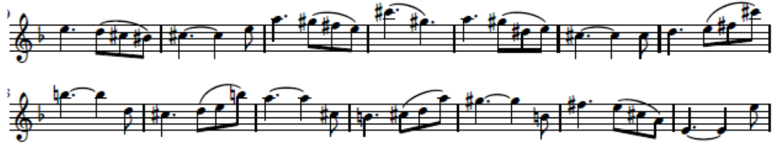
شكل (١٢) يوضح الأداء المتقطع Staccato

وينتهي هذا الجزء من العمل بتدرج في البطء (rall) وتنتهي بتكرار نغمة (لا) تمهيدا للعودة لإعادة الصيغة الأولى (A2) من اناكروز م ٤١:٥٦ في سلم المقطوعة الاساسي ري الصغير وفي هذا الجزء إعادة تامة للصيغة الأولى مع الأختلاف في نهاية الصيغة تمهيداً للانتقال للفكرة الأخيرة في المؤلف.