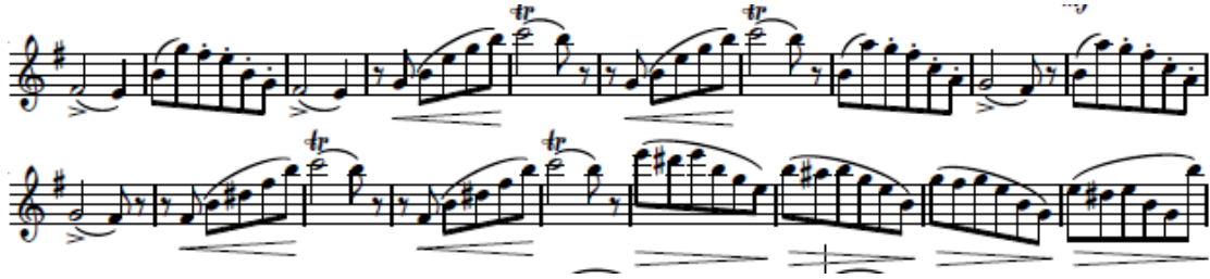
شكل (١٦) يوضح حلية التريل والتلوين الصوتي والأداء المتقطع

diminuendo > crescendo < والتدرج من الأداء القوي إلى الأداء الخافت وأستخدام النبر القوي.