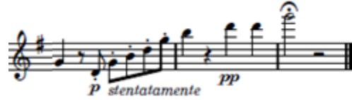
شكل (٩) يوضح انتهاء العمل

وفي م ٥٦ بدأ بالتمهيد للانتهاء من العمل بعمل أربيج صاعد علي مسافة اكتافين بداية من نغمة ري بصوت خافت P وبصعوبة stentatamente وبأداء متقطع Staccato انتهاءً بنغمة صول ٣ بوقفة مطولة ◡ للاحساس بالقفلة التامة علي اساس سلم المقطوعة سلم صول الكبير في منطقة الجوابات .