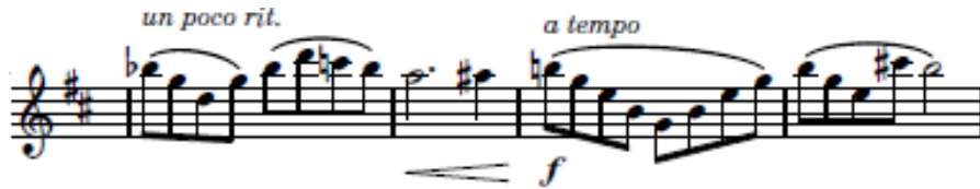
شكل (٢) يوضح التحكم في السرعة

الصيغة الثانية B : تبدأ هذه التيمة اللحنية من م١٧ : م٣٢ ويقوم في هذا الجزء بالاستعراض اللتويج في اللحن والمسارات اللحنية صعودا وهبوطا بأداء متصل Legatto ويبدأ بتخفيض السرعة تدريجياً في م٢٣ ويبدأ في العوده للزمن الاساسي للمقطوعة في م٢٥ وذلك لإظهار قدرة عازف الفلوت علي التحكم في السرعة والنفس أثناء أداء المقطوعة وتنتهي هذه التيمة اللحنية في م٣٢ ب Rall (التدرج في السرعة للأبطئ تدريجيا) تمهيدا لاعادة الصيغة الاولي A2 ولكن بشكل مختلف .