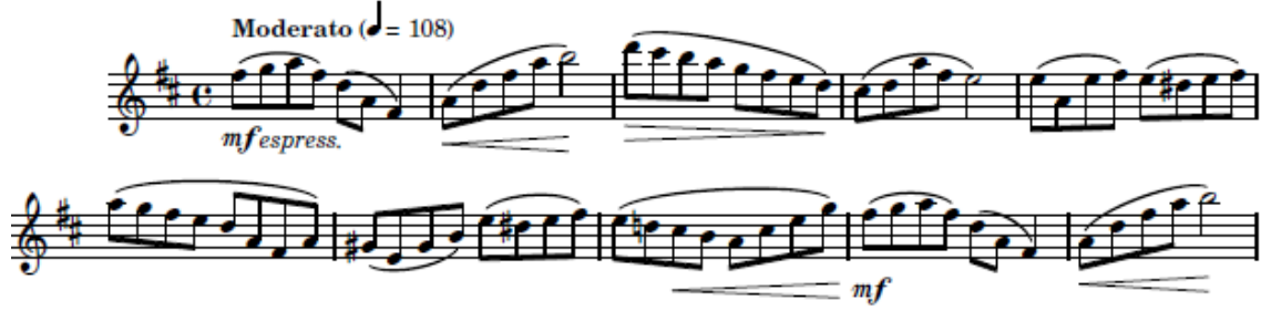
شكل (١) يوضح التتابع اللحني الصاعد الهابط وإستخدام ديناميكيات التعبير

العفقات الطبيعية في المناطق الصوتية المختلفة للفلوت، والتي يجب أن يجيدها العازف بشكل مهاري وتنتهي هذه التيمة اللحنية بقفلة تامة في سلم ري الكبير .