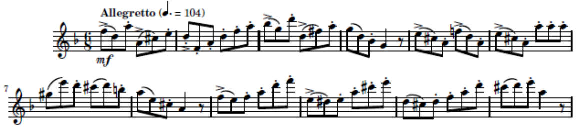
شكل (١٠) الاستعراض اللحني لفكرة الاولي A

تتكون المؤلف من صيغة ثلاثية بسيطة (A-B-A2-C) في سلم ري الصغير الصيغة الأولى A: تبدأ هذه الصيغة من م ١ : م ١٦ الكروش الخامس بأستعراض لحني لسلم المقطوعة عن طريق عمل اربيجات صعودا وهبوطا بشكل سريع Allegretto من نغمة فا أستعراضا لسلم المقطوعة الأصلي وهو سلم ري الصغير بشكل متوسط القوه m.F في العزف علي آلة الفلوت بأستخدام ايقاعات بسيطة .